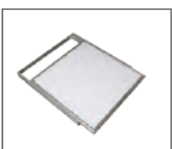
Surface mounting kits